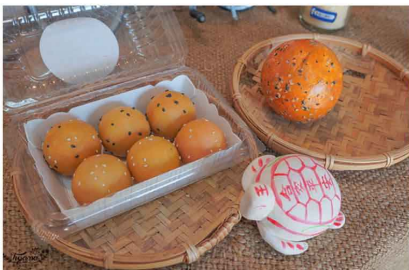
【澎湖古棗味 - DIY】